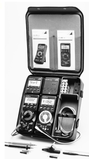
F840 (exemple de disposition)