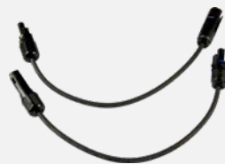
PV-Adapterset TYCO-MC4 (Z360J)