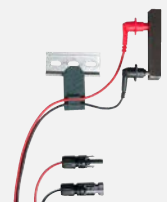
Magnetische Messspitzen mit MC4-Stecker (Z502Y)