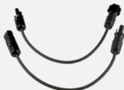
PV-Adapterset SUNCLIX-MC4 (Z360H)