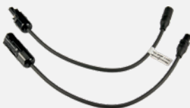
PV-Adapterset MC3-MC4 (Z360K)