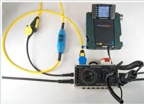
Elektrische Prüfung mit dem PROFITEST MXTRA

Prüfung von PRCDs Typ S und K durch Simulation von Fehlerfällen nach DIN VDE 0701-0702, BGI / GUV-I 608 sowie Herstellerangaben mit dem PROFITEST PRCD und dem PROFITEST MXTRA