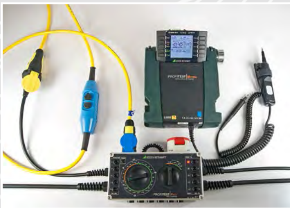
Simulation von Fehlerfällen

Die SPE-PRCD (Switched Protective Earth - Portable Residual Current Device) gibt es in verschiedenen Ausführungen. Diese können u. a. wie ein Verlängerungskabel zwischen einen elektrischen Verbraucher – i.d.R. ein Elektrowerkzeug und einer Steckdose installiert / montiert werden.