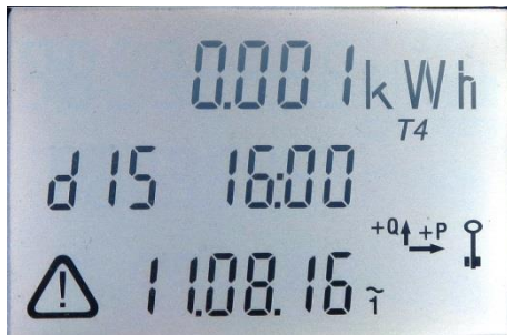
Abb. 2: Ungültiger Wert durch Tarifwechsel

Gekennzeichnet wird ein Tarifwechsel während einer Periode durch das Symbol unten links in der Ecke.