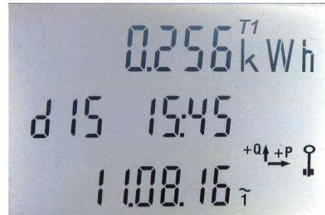
Abb. 1: Zählerstandgang-Menü